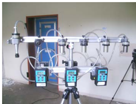
stationär im Raum