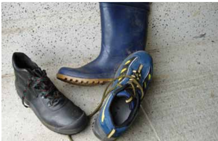
Abb. 3 Geeignetes Schuhwerk

Ist andauernde Steharbeit ohne wirksame Bewegungsmöglichkeit über mehr als vier Stunden nicht mit technischen oder organisatorischen Mitteln zu vermeiden, muss der Arbeitgeber geeignetes Schuhwerk als persönliche Schutzmaßnahme (TOP-Prinzip) zur Verfügung stellen.